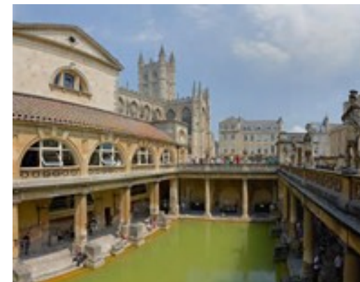
Thermes de Bath