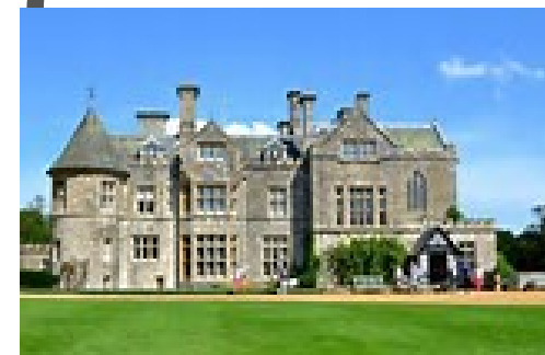
Beaulieu Palace House