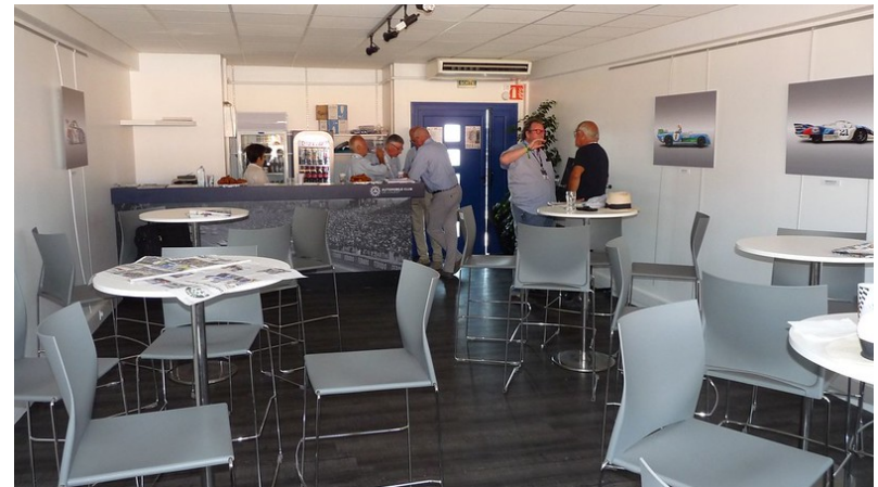
Accueil dans la loge de l'ACO