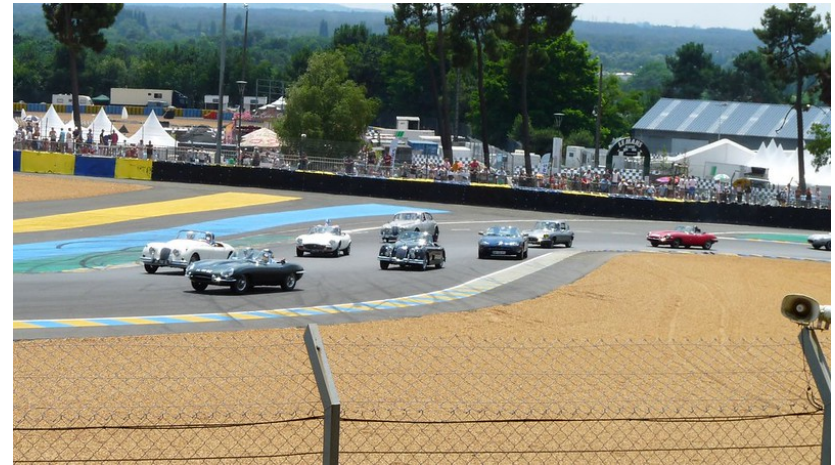
Tour de piste clubs Jaguar / Jaguar France