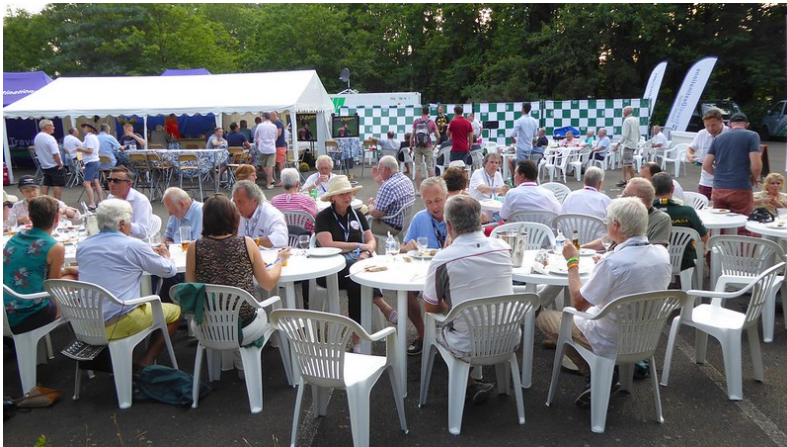
Dîner BBQ Travel destination/JEC UK