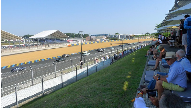
Course Jaguar dans la loge JEC UK