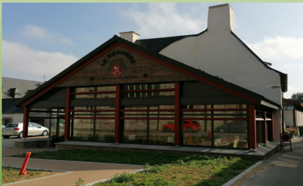
RESTAURANT CARHAIX LA ROTONDE

Hôtel Noz Vad 12 Bd de la République 29270 CARHAIX PLOUGUER