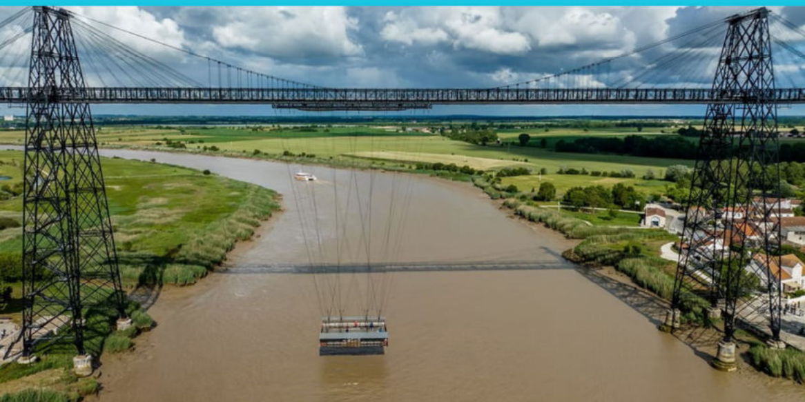
Pont Transbordeur Rochefort

Matin : Visite guidé du pont transbordeur de Rochefort le matin.